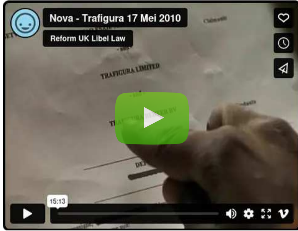
Vimeo | Trafigura चे ड्रायव्हर्स: “आम्हाला लाच दिली गेली”

“ Vimeo टिप्पणीकार: ‘तुम्ही कोण असाल तरी हे उपलब्ध करून दिल्याबद्दल धन्यवाद. तुम्हाला माहिती आहेच की यूके मध्ये आम्हाला हे वाचण्याची किंवा बघण्याची परवानगी नाही.’